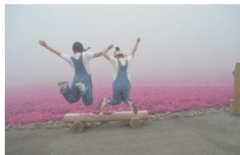
第12回 優秀賞 「ジャンプ」