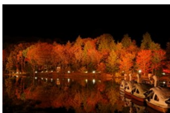
第12回最優秀賞 「天空の紅葉狩り」