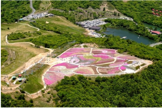
芝桜園地（スキー場山頂部 5月中旬）