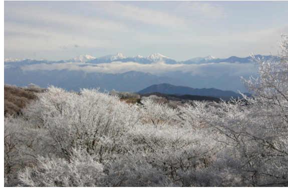
南アルプス（スキー場山頂より）