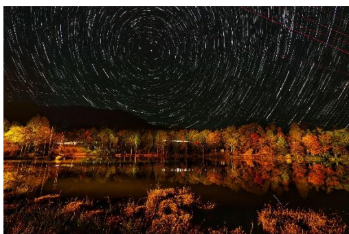
紅葉ライトアップ