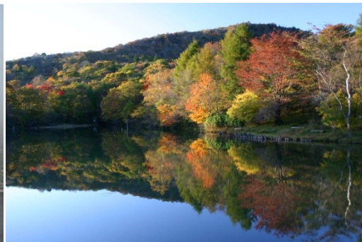
芹沼池（紅葉10月中旬）