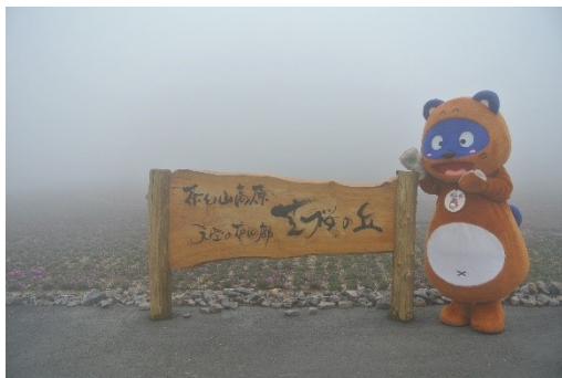
芝桜園地&ポンタ（スキー場山頂部）