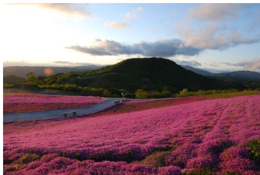
芝桜園地 (スキー場山頂部 5月中旬)